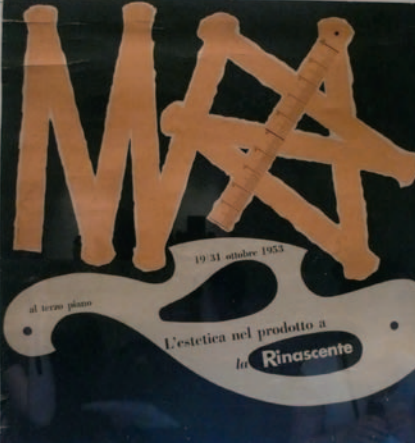
L'identité visuelle de la première édition du Compasso d'Oro présentée à l'occasion de l'exposition "Unicità d'Italia. Made in Italy e Identità nazionale".