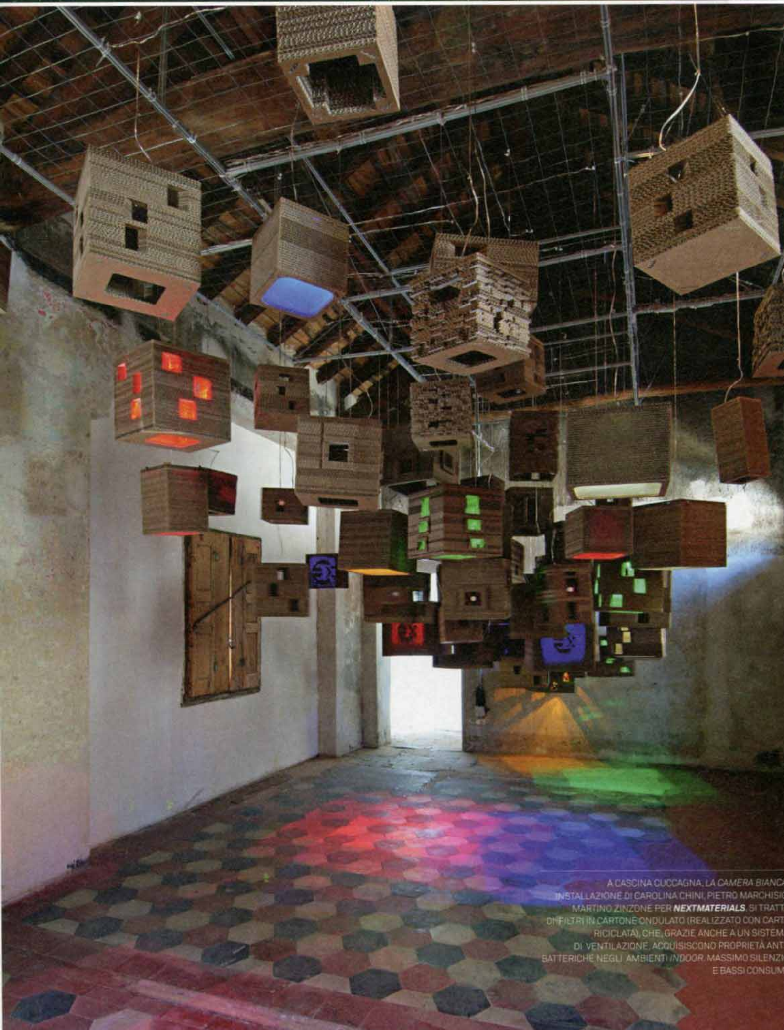
A CASCINA CUCCAGNA, LA CAMERA BIANCA È UN'INSTALLAZIONE DI CAROLINA CHINI, PIETRO MARCHISIO E MARTINO ZINZONI PER NEXTMATERIALS . SI TRATTA DI FILTRI IN CARTONE ONDULATO (REALIZZATO CON CARTONE RICICLATO), CHE, GRAZIE ANCHE A UN SISTEMA DI VENTILAZIONE, ACQUISISCONO PROPRIETÀ ANTIBATTERICHE NEGLI AMBIENTI INDOOR. MASSIMO SILENZIO E BASSI CONSUMI