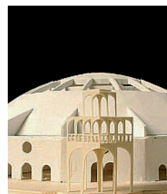
Tempio Dallo Ied

Eco-friendly anche i designers argentini e brasiliani che espongono Design Connection nella Galleria di via Mervigli, coordinati da Cienporcientodiseño di Buenos Aires. Sempre in tema ecologico, Corepla, il Consorzio Nazionale per la raccolta, riciclaggio recupero dei rifiuti di plastica, presenta il concorso Plastic4 2Tomorrow, per iniziare a progettare un futuro, dove il riciclo sia la norma per un ambiente ecologicamente compatibile, il 20 aprile dalle 19.30 alle Biciclette in via Tortona. Progetto etico anche quello degli studenti dello Ied pensato per una futura società sempre più multietnica, nasce così il «Il Tempio del design» (foto) nello Spazio Teatro Ied, Moda Lab di via Pompeo Leoni, dove è allestito un ipotetico Tempio delle Religioni, il visitatore esplora religioni e le culture del mondo attraverso un percorso reale, virtuale e spirituale. In tema di spiritualità, Tarshito, sotto il segno di «A stress-free world»