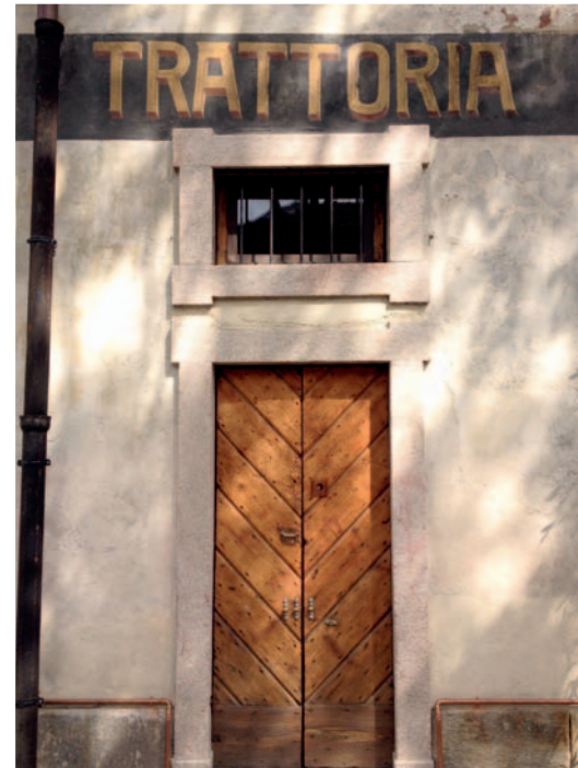
Cascina Cuccagna, une ancienne ferme du XVII e siècle préservée et aujourd'hui réhabilitée.