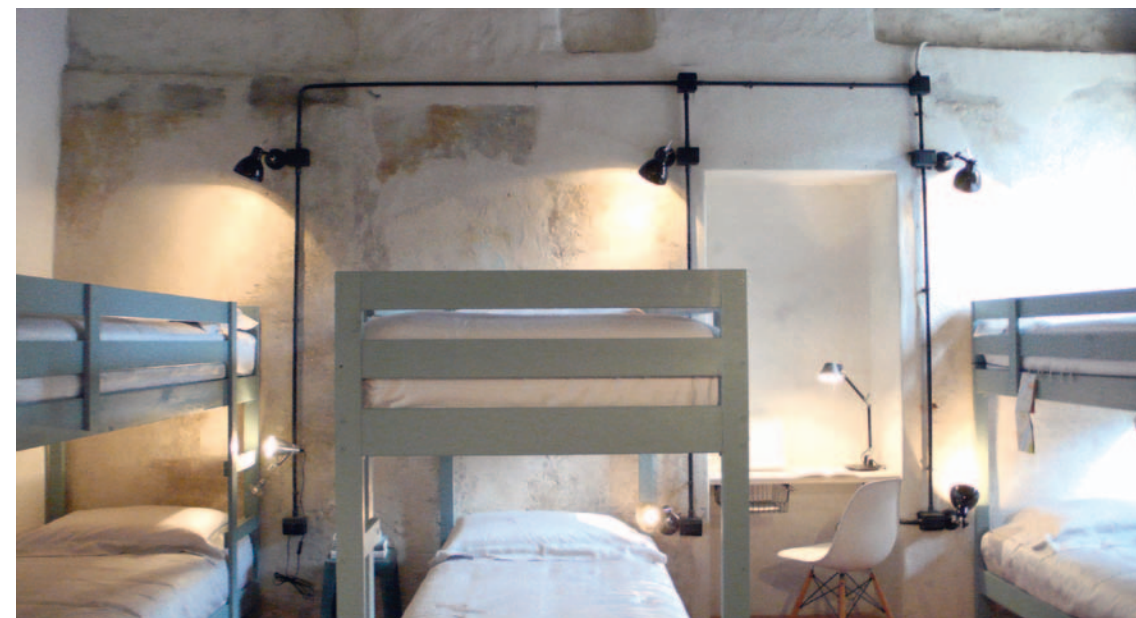
Les chambres collectives de l'auberge aménagées par CasaFacile avec du mobilier Ikea, des pièces de Bruno Munari et des luminaires Flos.