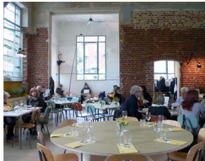
Le restaurant "Un posto a Milano" propose une carte de produits issus de l'agriculture biologique.